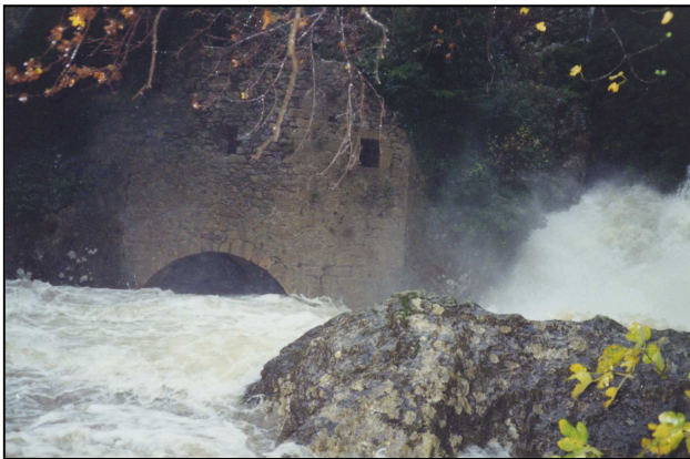
Crue de décembre 1997

Les moulins sont très anciens. Certains actes prouvent qu'ils existaient déjà en l'an 1000 (AD Hérault-470-493). Ils furent détruits plusieurs fois au cours de leur histoire. En 1629, ils furent rasés car ils avaient servi de refuge durant les guerres de religions (470-493). Le 15 septembre 1741, il furent « emportés » par une inondation ce qui a nécessité leur « rétablissement » moyennant la somme de douze cent soixante quinze livres. Pour financer le chantier, le seigneur de Vissec a dû vendre une métairie à Blandas. (d'après une quittance du 2 septembre 1742 - 460a-493). On raconte qu'en 1870, les meuniers durent se réfugier sur les toits (470-493). Ils furent définitivement abandonnés, en 1907, après que le flot impétueux eut complètement ravagé les installations (470-493). En 2000, la Mairie de Vissec effectue des travaux importants de réhabilitation des Moulins et y installe une exposition permanente composée de panneaux explicatifs destinés à informer le promeneur. D'autres projets d'utilisation de la force de l'eau ont été étudiés. Par exemple, vers 1900, un projet de barrage hydroélectrique destiné à alimenter les usines Brun d'Arre grâce à une ligne électrique traversant la cause de Blandas, était à l'étude (14-493).