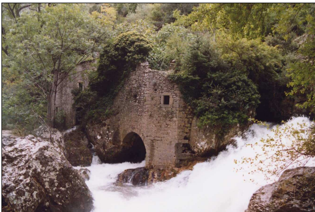
Les moulins en 1993 avant leur rénovation